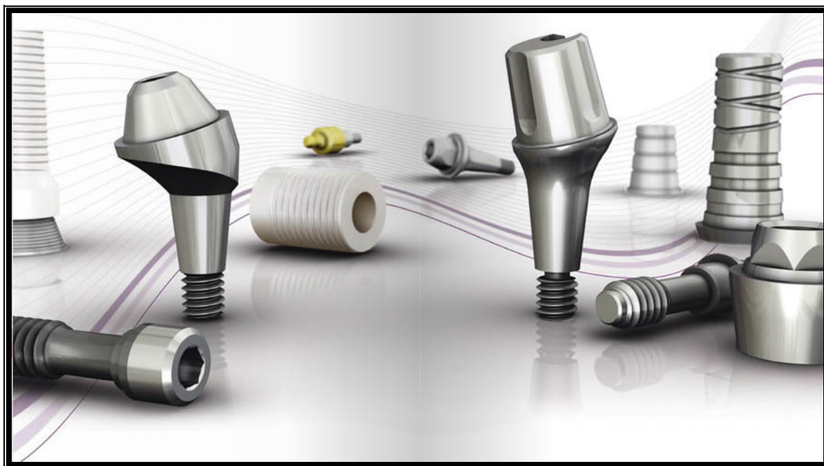
FIGURA 3 – Componentes Protéticos