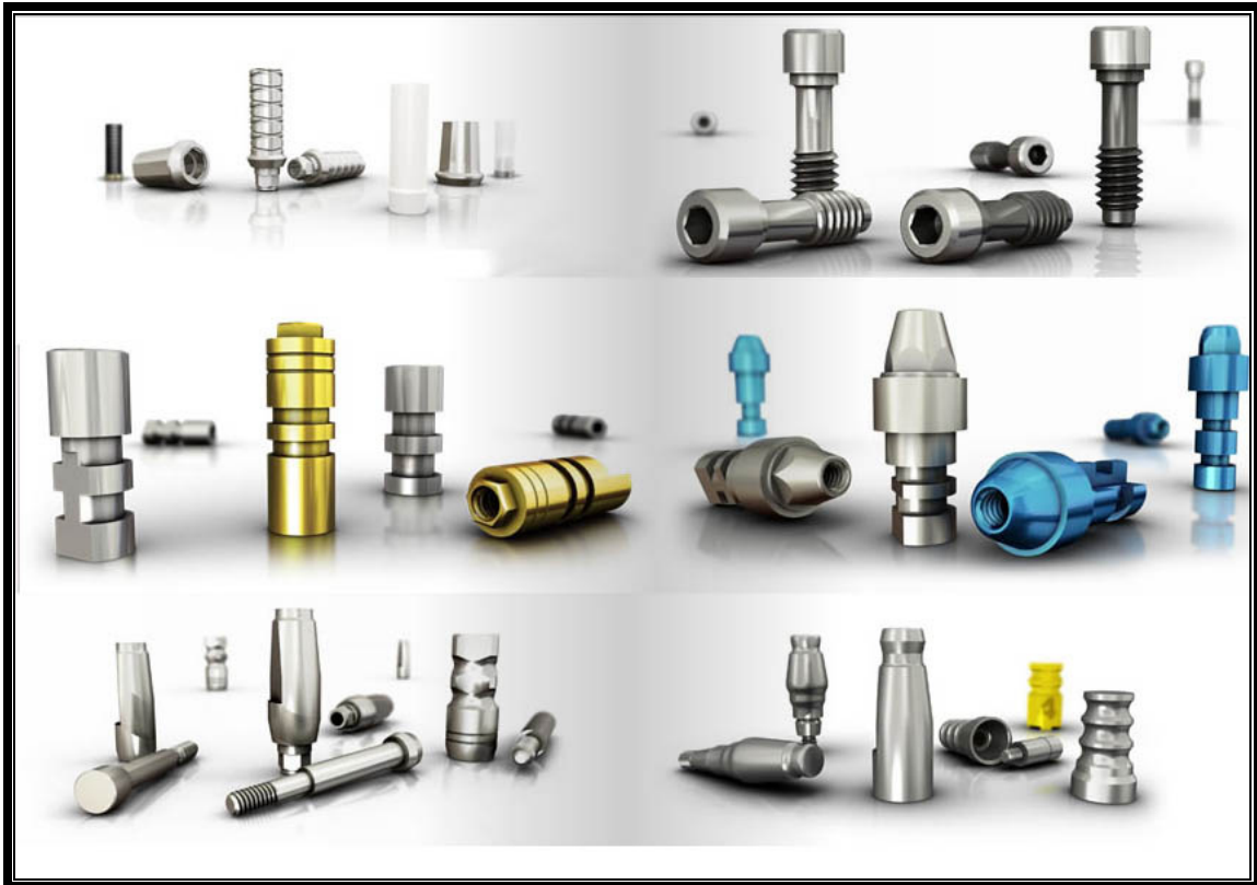
FIGURA 4 – Componentes Protéticos